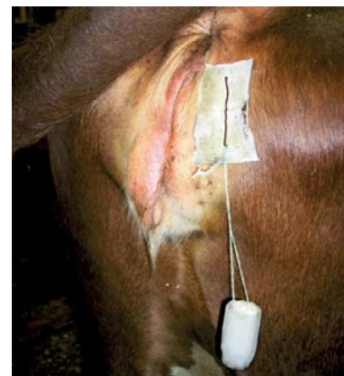
Tampong full av urin, festet til hårnål som er limt fast ved siden av skjedeåpningen.

Oppdatering 2019: I stedet for hårnål og tape "pierces" en hårstrikk fast i gropa ved siden av skjeden, i høyde med øvre åpning på skjeden. Tampongen festes i strikken og føres inn i skjeden: