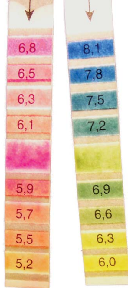
To pH-strips dyppet i urin og holdt opp mot lyset. Sammenlign det umerkede indikatorfeltet i midten med fargeskala-feltene og les av pH-verdien: pH ≈ 6,8 på venstre strips og pH ≈ 6,6 på høyre. Konklusjon: ønsket urin-pH mellom 6 og 7.